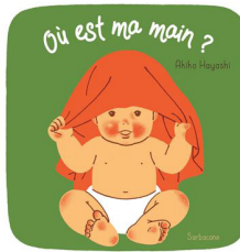
Akiko HAYASHI Ed. Sarbacane