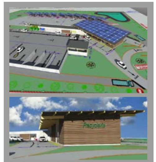
Plan de la future déchèterie de Cléguérec

La Région encourage les collectivités à envisager leurs déchèteries non plus comme le lieu où sont stockés les déchets en fin de vie, mais bien comme un véritable outil de réemploi et de valorisation, dans une logique de développement durable soutenue par les engagements pris par les élus dans le cadre du PCAET (Plan Climat Air Energie Territorial).