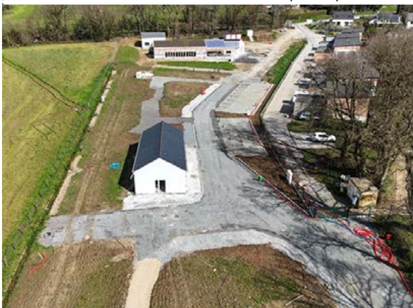
Camping intercommunal de Pontivy Communauté

Le conseil communautaire de Pontivy Communauté du mardi 26 mars 2024 a approuvé la concession de délégation de service public pour le développement et l'exploitation de nouveau camping intercommunal à l'association VVF. Il ouvrira au printemps 2025.