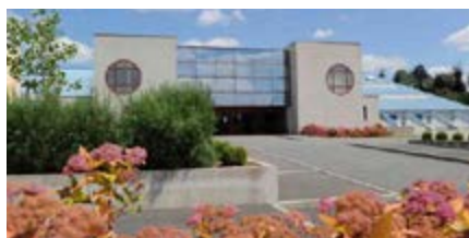
Parc des expositions, Pontivy

Pas d'augmentation des taux d'impositions cette année